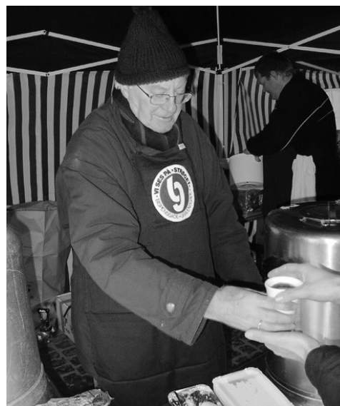
„Pas på, det er varmt“ Sniller på Glög-job.