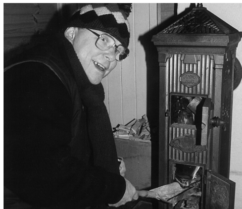
„Paga” lægger en pind på.

Det kan til slut tilføjes at den berømmelige Ryå-sejlads af Sir Galahad roverklan blev betroet opstartet af Thiselauget i Sct. Georgs Gildernes regi.