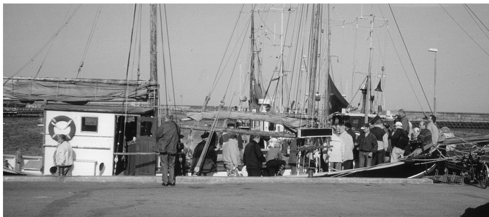
Gildetur til Hirsholmene.