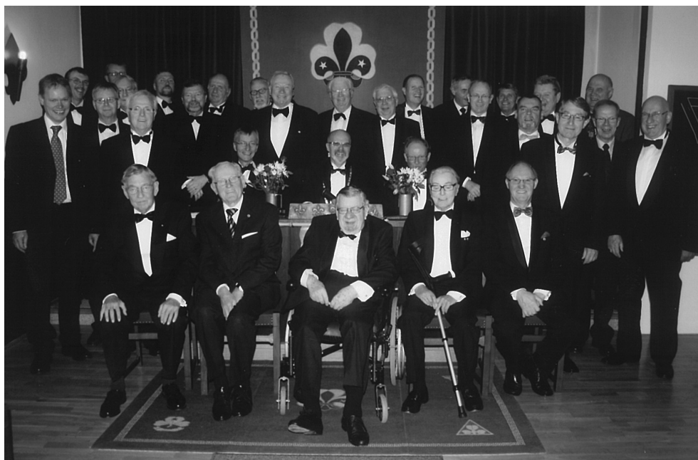
8. Gilde 2007.

Kun på den måde kan vi med sindsro se frem til at holde mange flere fødselsdage i et godt og dynamisk Gilde.