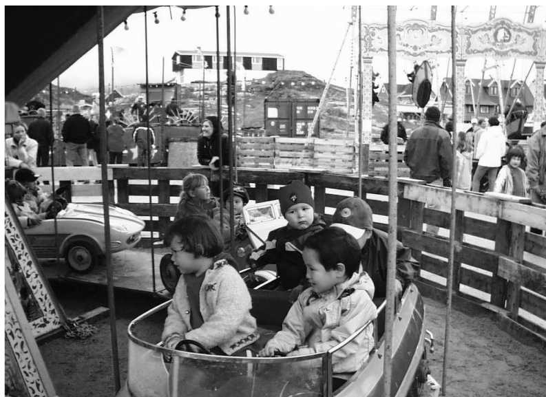
Tivoli i Nuuk.

Gildet blev oprettet i 1961. Det var i en periode, da mange danske gildebrødre blev udstationeret i Grønland og ønskede at fortsætte deres gildearbejde her. De fleste udstationeringer var af kortere varighed, hvilket gildet var præget af, når der skulle planlægges aktiviteter, trods det blev det et meget aktivt gilde.